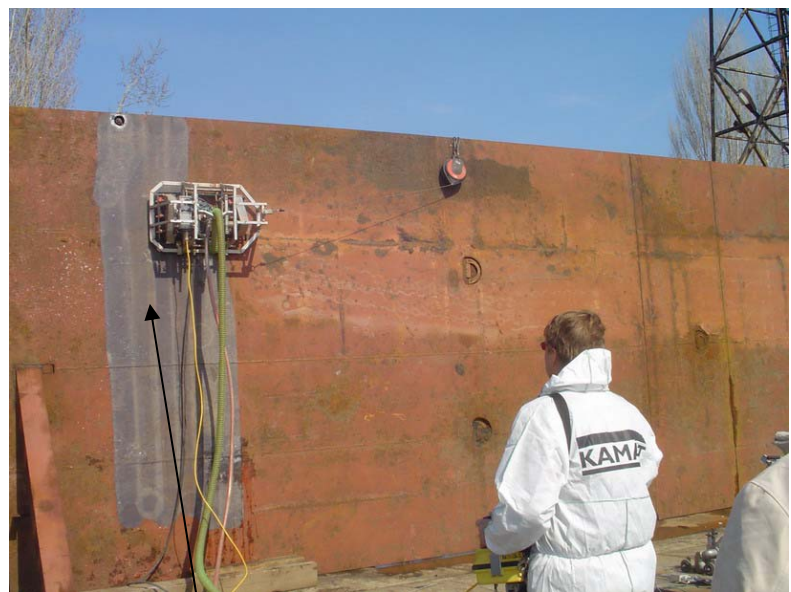
Bild oben: Das Verfahren (SHC 2500) mit Absaugung und Filterung (KAMVAC)

Bild links: Der SHC 2500 im Einsatz OHNE Absaugung