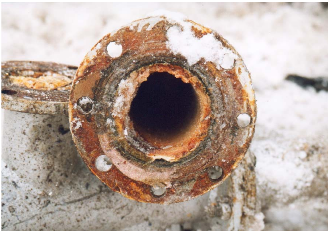
Bild oben: Rohr DN 100 aus einem Kunststoffwerk mit Kunststoffablagerungen - vor der Reinigung.

Für die Rohrreinigung können manuelle oder automatische Verfahren ( siehe hierzu unser AT Bericht Nr.: A 03-4 ) eingesetzt werden.